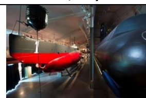
27 Machina wojenna Neptun