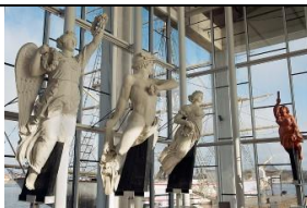
14 Sala galionów