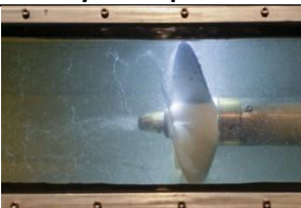
23 Wielkie wyzwanie