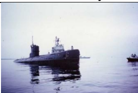
18 Pięć incydentów z udziałem obcych okrętów podwodnych