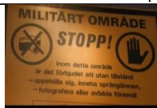
16 Zimna Wojna