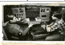
20 Życie na pokładzie

Hala Okrętów Podwodnych (numer pod zdjęciem odpowiada numerowi audioprzewodnika)