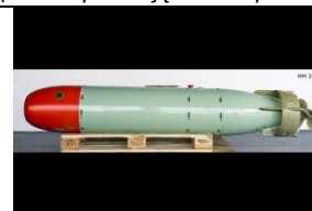
21 Wyścig zbrojeń