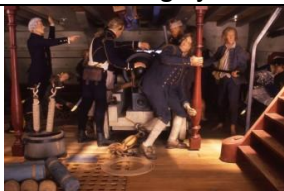
12 Zatoka Wyborska