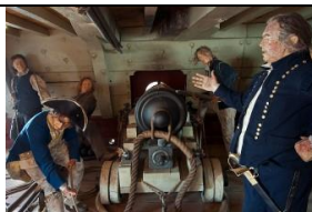
13 Pokład działowy