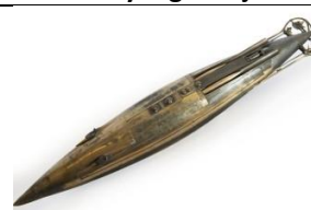
24 Nowa, ukryta broń