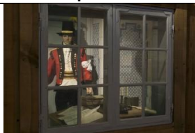
07 Pokój pisarza