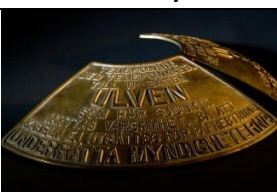
26 Katastrofa okrętu Ulven