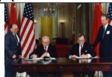
17 Koniec zimnej wojny