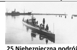
25 Niebezpieczna podróż okrętem Hvalen