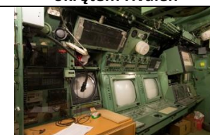
28 Obowiązek zachowania tajemnicy