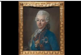
11 Gustav III