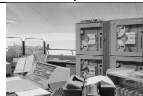
29 Rozwój technologiczny