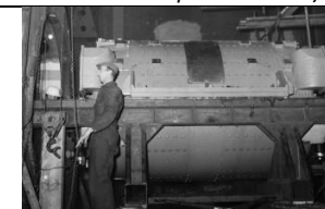
22 Szukanie dźwięków