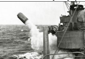
19 Polowanie na okręty podwodne