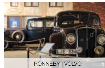
RONNEBY I VOLVO

Popłyniesz w rejs na samotną skalistą wyspę Hanö, słynącą z pięknych widoków i marynistycznej historii. Dziś wyspa ma zaledwie 30 mieszkańców! Na wyspie miejscowi gospodarze ugoszczą Cię tradycyjną szwedzką „fika”, czyli kawą z ciastkiem. Podczas wyprawy zobaczysz też zabytki regionu: od kamienia runicznego z VI wieku, po średniowieczny kościół St. Nicolai.