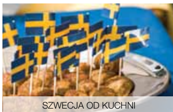
SZWECJA OD KUCHNI

W Muzeum Morskim zjedźcie do tunelu podwodnego, nauczycie się strzelać z działa i zobaczycie, jak kiedyś żyło się na okręcie. Maluchy będą szaleć w wiosce dziecięcej Barnens Gård lub na wielkim placu zabaw Barnens Lekland, a nieco starsi odnajdą radość dzieciństwa w labiryncie zagadek Boda Borg. Kiedy dzieci usną w wygodnej kabinie, na dorosłych czeka zabawa na statku.