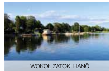
WOKÓŁ ZATOKI HANÖ

Czekają Cię degustacje w miejscach, których nie znajdziesz w zwykłym przewodniku. Na tradycyjnej farmie owiec skosztuj jagnięciny – to specjal tradycyjnej kuchni. W wędzarni ryb poznasz oryginalny smak tutejszego łosia czy węgorza. Spróbujesz też świeżego koziego sera, a regionalny obiad doda Ci sił do dalszego zwiedzania. Droga do serca prowadzi przez żółdek... Zakończaj się w Szwecji!