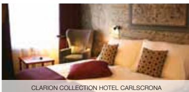
CLARION COLLECTION HOTEL CARLSRONA