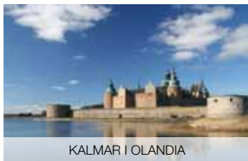
KALMAR I OLANDIA

Poznaj jeden z najbardziej urokliwych regionów Szwecji. Otwórz się na nowe doświadczenia!