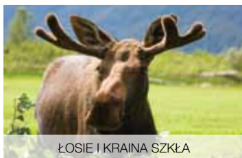
ŁOSIE I KRAINA SZKŁA

Odbij z rąk szwedzkich zamków i odwiedź największą barokową katedrę w Szwecji! Urzeknie Cię renesansowy zamek oraz malownicza starówka Kalmaru. Sześciokilometrowy most poprowadzi Cię wprost na Olandię. Słynne olandzkie wiatraki poznasz w Lerkaka. Dzięki kamieniowi runicznemu z epoki wikingów poznasz tajemnice skandynawskich run i mitologii nordyckiej.