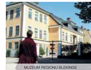
MUZEUM REGIONU BLEKINGE