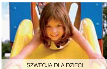
SZWECJA DLA DZIECI

W drodze na wyspę Almö odszukaj cmentarzysko z epoki wikingów – Hjortahammar i jego kamienne kręgi. W skałach w Möckleryd, około 3000 lat temu wyryto zagadkowe rysunki naskalne... Na wyspie Sturkö, w wędzarni ryb, odkryjesz tajemnicze smaku łosia czy węgorza, przygotowanego jak przed wiekami. Niech prowadzą Cię wikingowie!