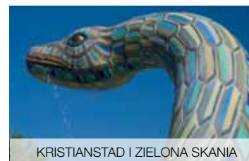
KRISTIANSTAD I ZIELONA SKANIA

Odkryj malowniczą przyrodę oraz poznaj historię zakłętej w zabytkowych murach. Przejdź się po najpiękniejszym parku w Szwecji. Przejrzyj się w jeziorze Trolle i posmakuj orzeźwiającej wody zdrojowej. Podziwiał unikatową kolekcję zabytkowych modeli Volvo. Zachwyć się architekturą zabytków Bergslagen i poznaj historię Szwecji. Przepiękne zabytki Cię zainspirują.