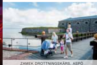
ZAMEK DROTTNINGSKÄRS, ASPÖ